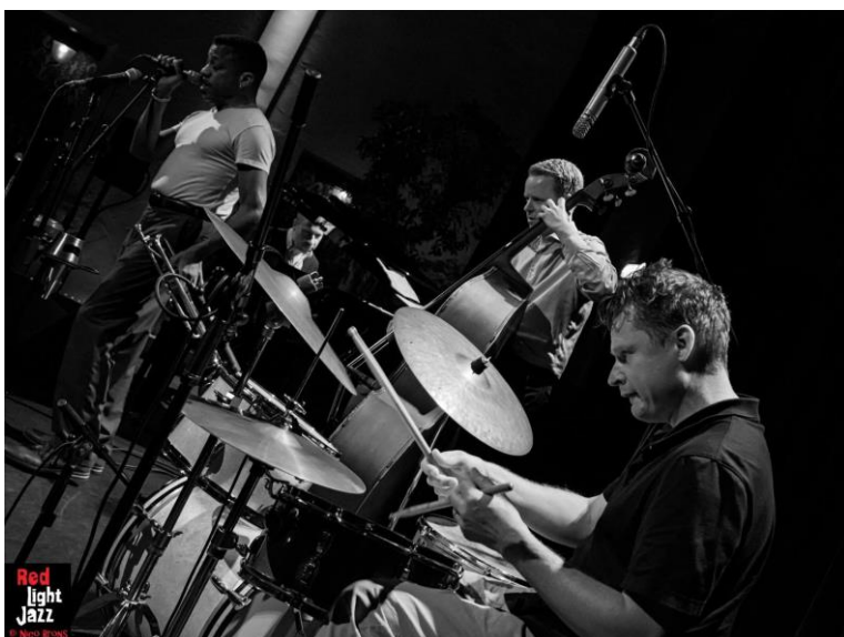
Optreden van het quartet op Red Light Jazz festival in Amsterdam